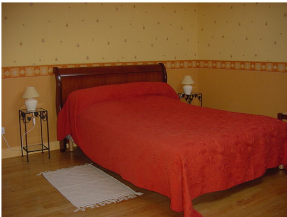
Chaque chambre est équipée d'un lit 2 personnes, d'un lit 1 personne. Equipement bébé assuré.